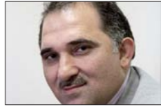
معن حمية *

دعوة الرئيس الأميركي دونالد ترامب لتوطن اللاجئين في أماكن لجوئهم، لا تعني النزاح السوريين حصراً، بل هي دعوة لتوطن الفلسطينيين بالدرجة الأولى، وإسقاط حق عودتهم إلى أرضهم وبيوتهم، وهو حق تكفله المواثيق والقرارات الدولية.